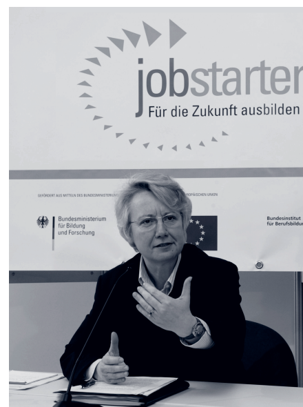
Bundesministerin Schavan bei der Pressekonferenz anlässlich der JOBSTARTER-Auftaktkonferenz

Die Bundesregierung setzt hier neue Akzente. So trat am 1. April 2005 das reformierte Berufsbildungsgesetz (BBiG) in Kraft. Zur Stärkung der betrieblichen Berufsausbildung in den Regionen wurde darüber hinaus das Ausbildungsstrukturprogramm JOBSTARTER initiiert. Für die Jahre 2005 bis 2010 stellt das Bundesministerium für Bildung und Forschung (BMBF) ein Fördervolumen von 100 Millionen Euro zur Verfügung, einschließlich Mittel aus dem Europäischen Sozialfonds (ESF). Das BMBF hat das Bundesinstitut für Berufsbildung (BIBB) mit der Durchführung des Programms beauftragt.