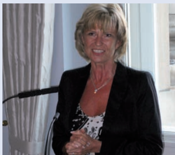
Dagmar Wöhrl, Vorsitzende des Ausschusses für wirtschaftliche Zusammenarbeit und Entwicklung