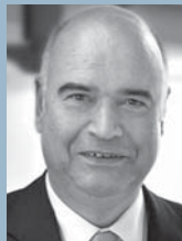
Otto Kentzler, Präsident des Zentralverbandes des Deutschen Handwerks