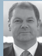
Olaf Scholz, Bundesminister für Arbeit und Soziales (BMAS)